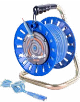
Prüfleitung auf einer Rolle blau 75 m / 100 m / 200 m

WAPRZ075REBBSZ WAPRZ100REBBSZ WAPRZ200REBBSZ