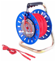
Prüfleitung auf einer Rolle rot 75 m / 100 m / 200 m

WAPRZ075REBBSZ WAPRZ100REBBSZ WAPRZ200REBBSZ