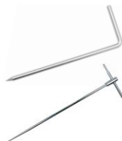
Erdspieß 25 cm / 80 cm