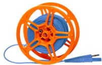
Prüfleitung 15 m auf Spule blau