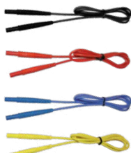
Prüfleitung 1,2 m (Bananenstecker) schwarz / rot/ blau / gelb

WASONBUOGB1 WASONREOGB1 WASONBLOGB1 WASONYEOGB1