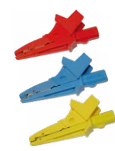
Krokodilklemme 1 kV 20 A rot/ blau / gelb

WAPRZ1X2BLBB WAPRZ1X2REBB WAPRZ1X2BUBB WAPRZ1X2YEBB