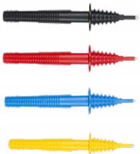
Prüfspitze 1 kV (Bananenbuchse) schwarz / rot/ blau / gelb

WAPRZ040YEBBSZ WAPRZ050YEBBSZ WAPRZ060YEBBSZ WAPRZ080YEBBSZ