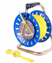
Prüfleitung auf einer Rolle gelb 75 m / 100 m / 200 m

WAPRZ075BUBBSZ WAPRZ100BUBBSZ WAPRZ200BUBBSZ