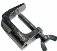
Kl. Schraubstock (Bananenstecker)